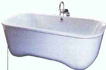
Vasca da bagno, Édition Andrée Putman (Hoesch, 4.600 €).