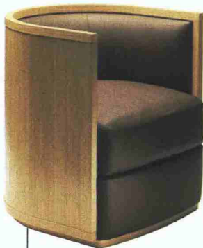
Novità 2007, la poltrona Sinuosa , in massello di faggio e rovere curvato. La seduta è in pelle Frau Heritage (Poltrona Frau, 2.600 €).