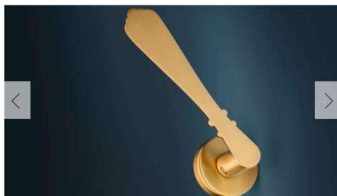
1-2 MANIGLIA CENERENTOLA DI VALLI&VALLI.