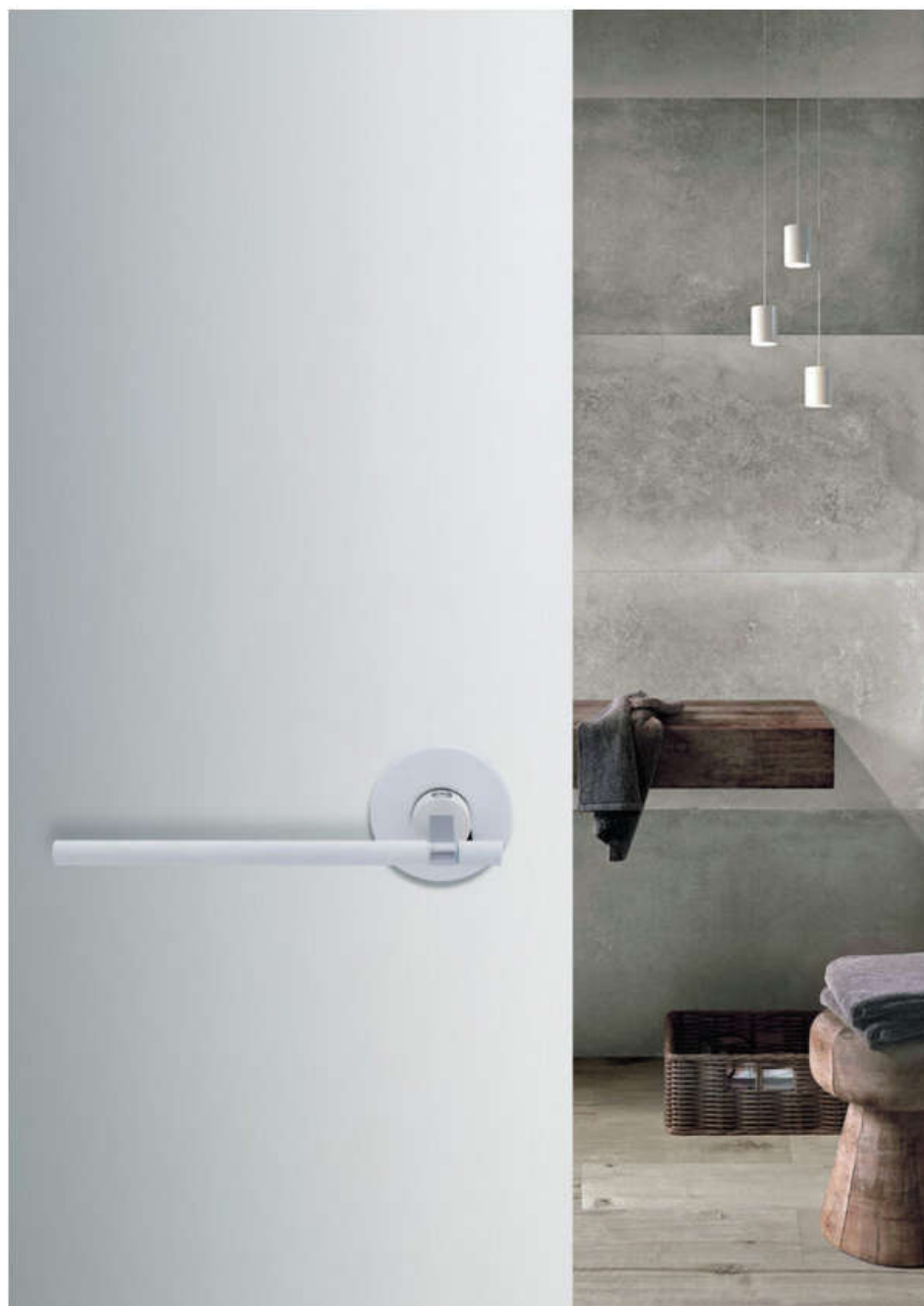
serie H1064 Naked