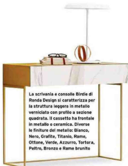
La scrivania e consolle Birdie di Ronda Design si caratterizza per la struttura leggera in metallo verniciato con profilo a sezione quadrata. Il cassetto ha frontale in metallo o ceramica. Diverse le finiture del metallo: Bianco, Nero, Grafite, Titanio, Rame, Ottone, Verde, Azzurro, Tortora, Peitro, Bronzo e Rame brunito