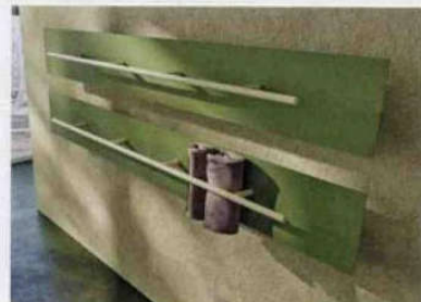
2009 Teso (con Luca Gonzo) ANTRAX